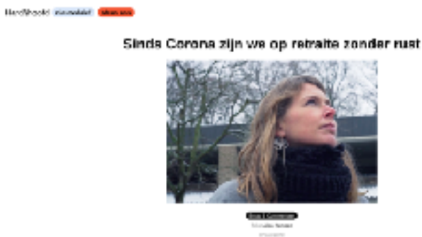
Re: Tijdsvensters op Hard//hoofd

Door Covid-19 zat er vertraging in de expositie van Tijdsvensters. De drie mini-documentaires zijn uiteindelijk van juni t/m augustus 2020 vertoond in een zaal van Buitenplaats Doornburgh.